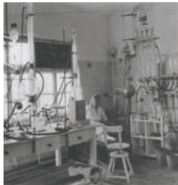
Einer der Laborräume im Forschungsinstitut One of the laboratories in the research institute

Den Kern der Anlage bilden zwei Gebäude von 75 x 12 Meter, welche durch einen Durchgang verbunden sind. Sie bestehen aus einem Erd- und zwei Dachgeschossen. Ihr Bau begann 1939. Im westlichen Verwaltungsgebäude waren Büroräume, Heizung, Packräume und die sogenannte „Prittzbacher Pfeffermühle“ untergebracht. In der ersten Etage waren Wohnungen und im zweiten Obergeschoss große Trockenböden.