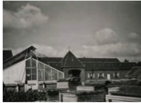
Blick auf das Glashaus 2. View of Glass House 2.

Ab 1939 errichtete die Firma Oscar R. Mehlhorn GmbH sechs Gewächshäuser, vier mit 30x6 Metern und mit mechanischem Sonnenschutz und zwei mit 50x3 Metern in Nord-Süd Ausrichtung mit einem Glas-Satteldach auf gemauertem Sockel.