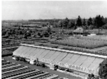
Blick auf das Glashaus 1, rechts das Blockhaus, links im Hintergrund die Baracken des Konzentrationslagers. View of Glass House 1, with the Blockhouse on the right and the barracks of the concentration camp in the background on the left.

Ab 1939 errichtete die Firma Oscar R. Mehlhorn GmbH sechs Gewächshäuser, vier mit 30x6 Metern und mit mechanischem Sonnenschutz und zwei mit 50x3 Metern in Nord-Süd Ausrichtung mit einem Glas-Satteldach auf gemauertem Sockel.