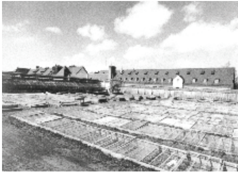
Frühbeete mit Blick auf das Forschungsgebäude. Cold frames with a view of the research building.