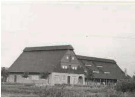
Das Gerätehaus mit Werkstätten und Trockenböden. The equipment shed with workshops and drying floors.