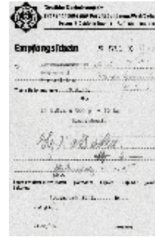
Honiglieferung für die Familie Himmler. Honey delivery for the Himmler family.