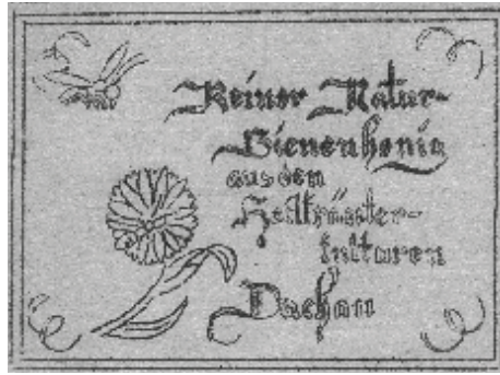
Etikett von Karel Kašák. Label by Karel Kašák. Foto: Archiv KZ-Gedenkstätte Dachau